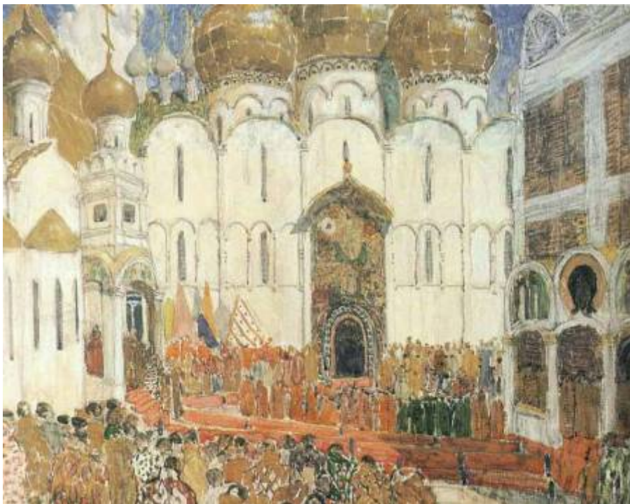
Ill. 77. Alexandre Golovine, esquisse pour Boris Godounov , opéra de Moussorgski, représenté à l'Opéra de Paris en 1908.