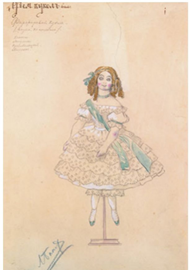
Ill. 86. Léon Bakst, esquisse de costumes pour le ballet de Josef Bayer La Fée des poupées , Théâtre Mariinski, Saint-Pétersbourg, 1903.