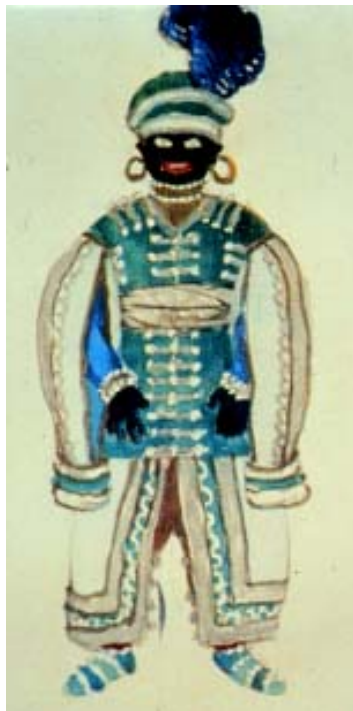
Ill. 81. Alexandre Benois, Négrillon , esquisse de costume pour le ballet Petrouchka de Stravinski, Ballets russes, 1911