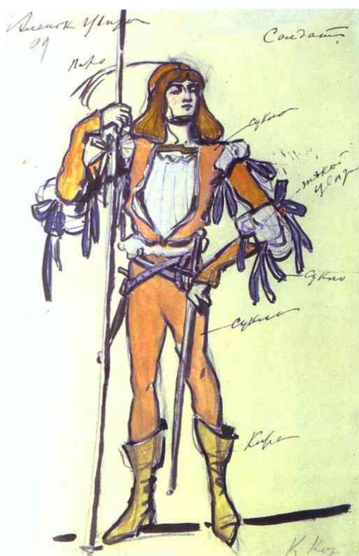
Ill. 78. Constantin Korovine, Esquisse de costume pour un ballet de Gartner , Théâtre Mariinski, 1909, aquarelle et gouache sur papier, Moscou, Musée théâtral Bakhrouchine.