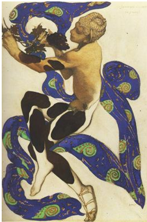
Ill. 85. Léon Bakst, Le Faune , esquisse de costume pour Nijinski dans L'Après-midi d'un faune de Claude Debussy, Ballets russes, 1912