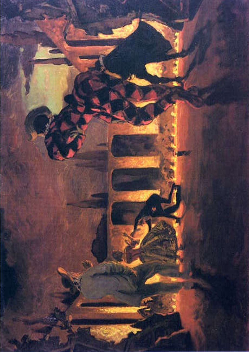
III. 82. Alexandre Benois, La Comédie italienne , 1906, huile sur toile, Saint-Pétersbourg, Musée russe.