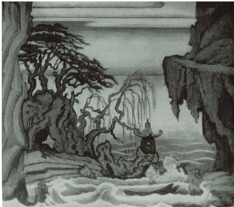
Ill. 84. Alexandre Benois, Esquisse pour Le Rossignol , opéra de Stravinski, représenté à l'Opéra de Paris, 1914. Saint-Pétersbourg, Musée russe.