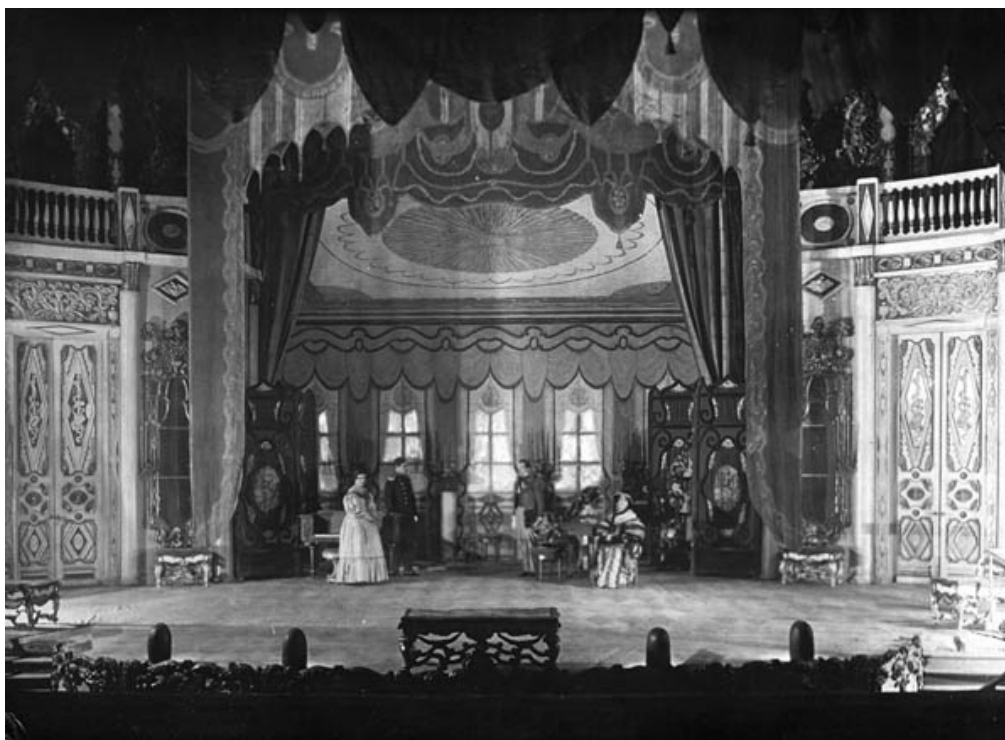
III. 72. Le Bal Masqué de Lermontov, photographie de la mise en scène de Meyerhold, 1917, décors Alexandre Golovine, Théâtre Alexandrinski, Saint-Pétersbourg.