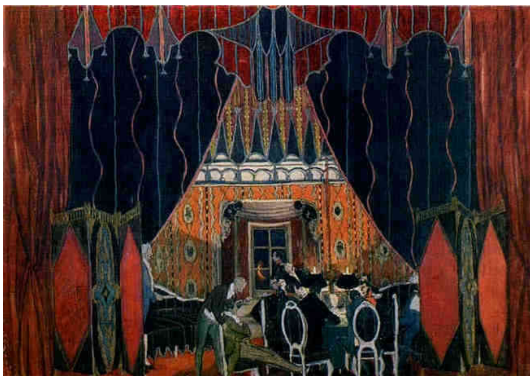
III. 73. Alexandre Golovine, La salle de jeu , dessin pour Le Bal masqué de Lermontov, 1917, papier sur carton, gouache, bronze, argent, 68,5 x 98 cm.