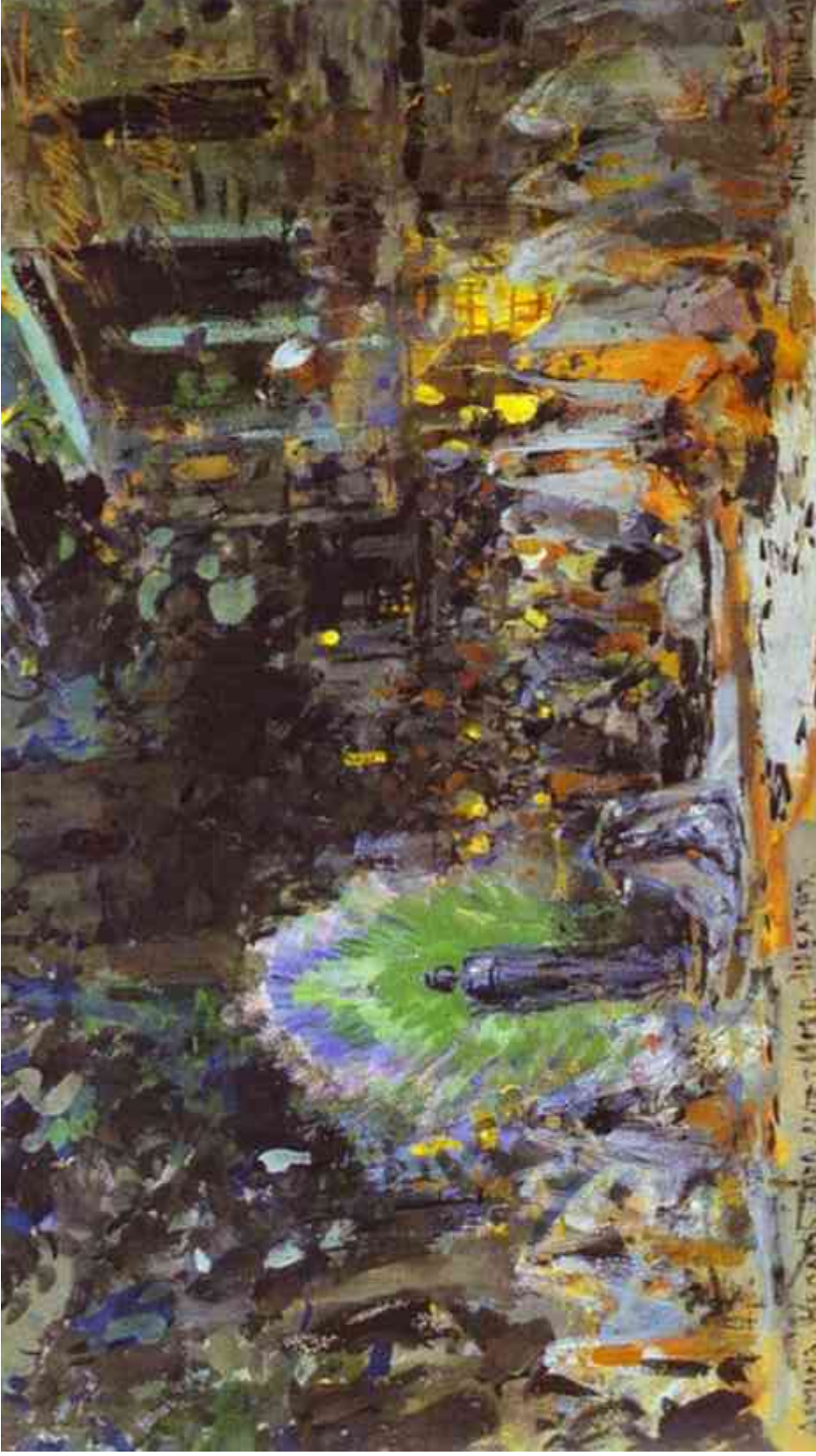
III. 70. Constantin Korovine, Le Château de Goudal , esquisse pour Le Démon , opéra d'Anton Rubinstein, Théâtre Mariinski, Saint-Petersbourg, gouache, Moscou, Musée théâtral Bakhrouchine.