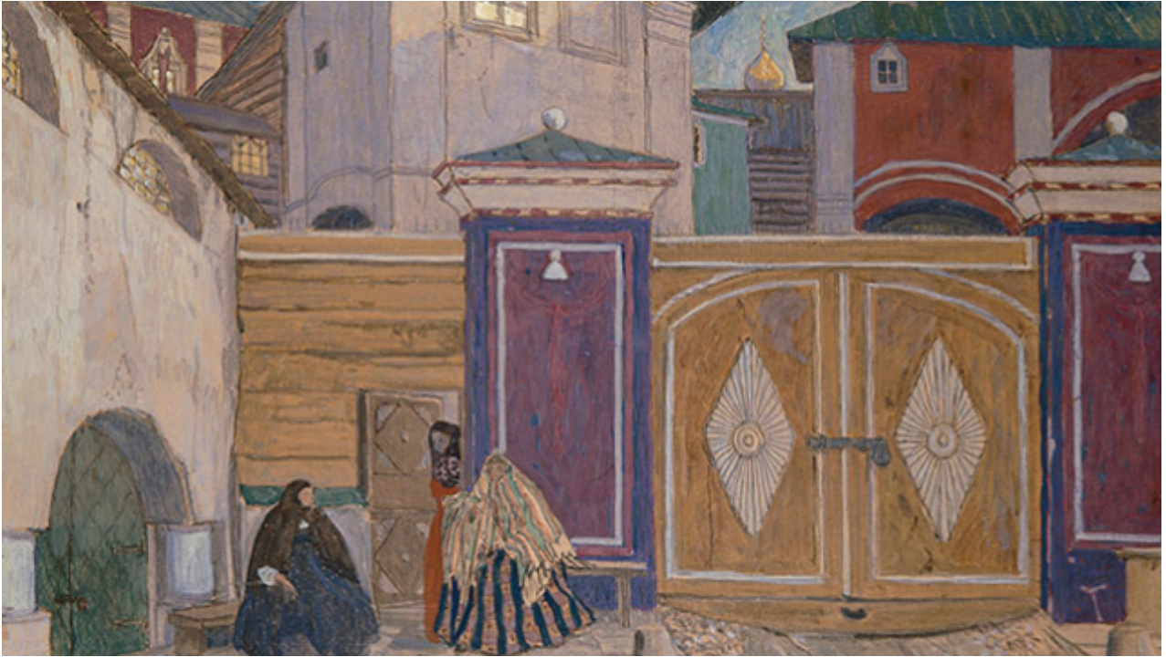
Ill. 76. Golovine, esquisse de décor pour L'Orage d'Ostrovski, mise en scène de Vsevolod Meyerhold, Théâtre Alexandrinski, Petrograd, 1916.