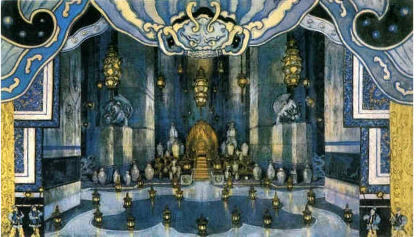
Ill. 83. Alexandre Benois, Esquisse pour Le Rossignol ( Le Palais de l'empereur : La Salle du trône, second acte ), opéra de Stravinski, Opéra de Paris, 1914, aquarelle, gouache sur papier, Saint-Pétersbourg, Musée russe.