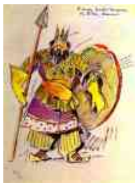
Ill. 79. Constantin Korovine, Le tsar Dodone en costume militaire , esquisse de costume pour l'opéra Le Coq d'or de Rimsky-Korsakov, Bolchoï, 1909, aquarelle et encres sur papier, Saint-Petersbourg, Musée théâtral.