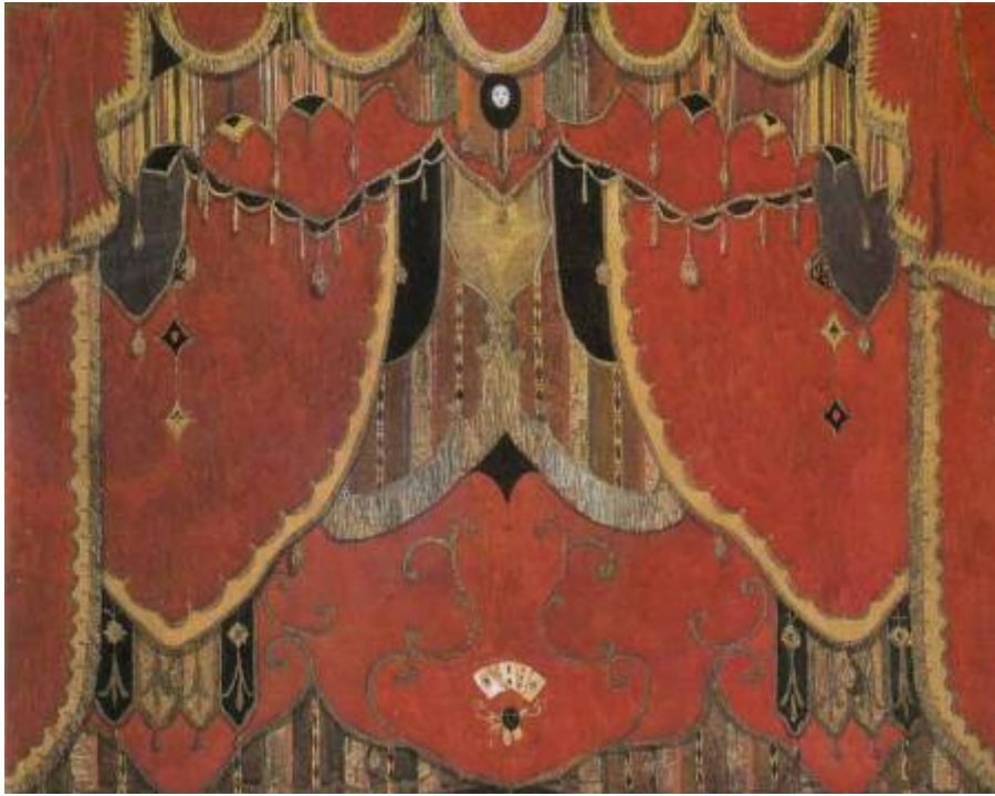
Ill. 74. Golovine, Rideau de scène pour Le Bal masqué , 1917.