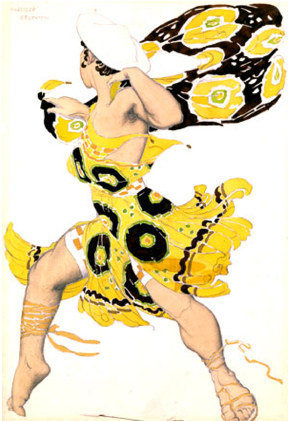
Ill. 87. Léon Bakst, Le Béoïen , esquisse de costume pour le ballet de N.N. Tcherepnine Narcisse , Ballets russes de Sergueï Diaghilev, 1911.