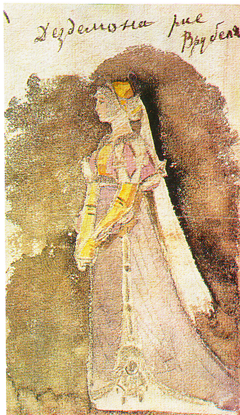
Ill. 149. Mikhaïl Vroubel, esquisse du costume de Desdémone, tiré de l'album de Stanislavski Motifs de costumes et de décors. Othello de Shakespeare, mise en scène de Stanislavski, Société d'Art et de littérature, 1896.