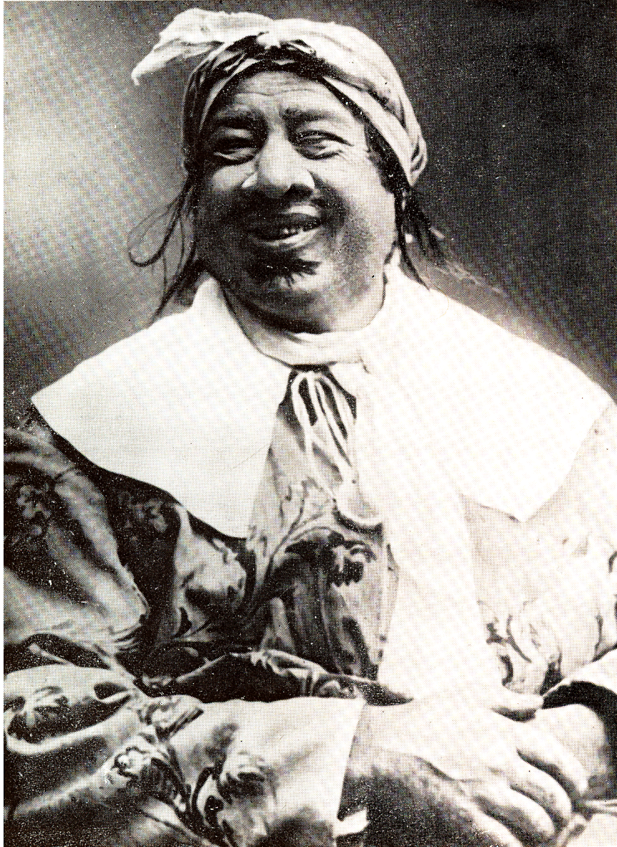
III. 161. Stanislavski dans le rôle d'Argan, Molière, Le Malade imaginaire , mise en scène Stanislavski et A. Benois, Théâtre d'Art, 1913.