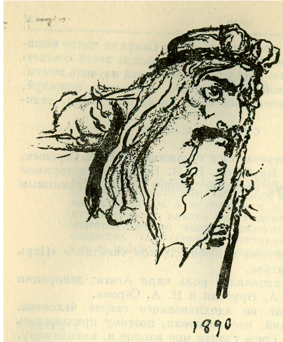
Ill. 148. Mikhaïl Vroubel, Dessin de Stanislavski dans le rôle du prophète Samuel , dessin pour la tragédie de Savva Mamontov, Le roi Saül , janvier 1890, cercle de Mamontov, décors et costumes Valentin Serov et Mikhaïl Vroubel.