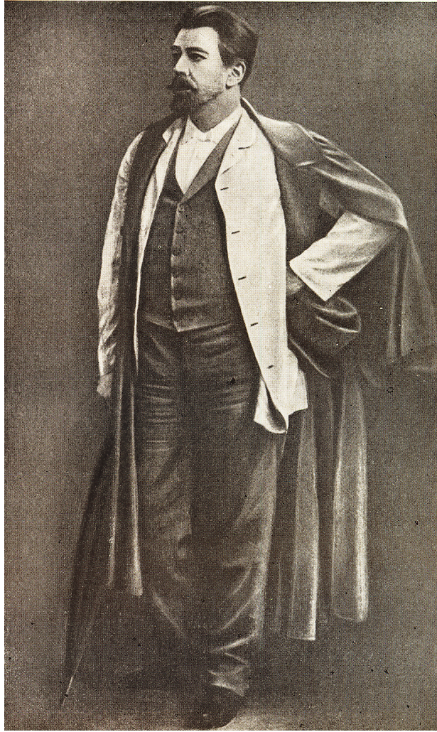
III. 152. Stanislavski dans le rôle d'Astrov dans Oncle Vania de Tchekhov, Théâtre d'Art à partir de 1899.