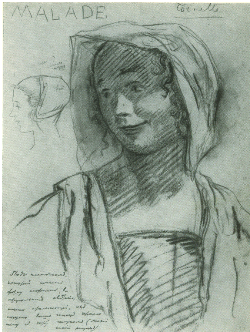
Ill. 162. Alexandre Benois, Esquisse du grimage de Toinette pour Le Malade imaginaire de Molière, Théâtre d'Art de Moscou, 1913, Musée Russe, Saint-Petersbourg.