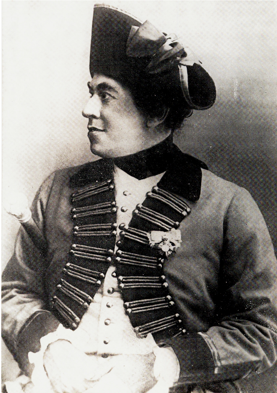
III. 164. Stanislavski dans le rôle du chevalier de Ripafratta, Goldoni La Locandiera , mise en scène Alexandre Benois et Stanislavski, Théâtre d'Art, 1914.