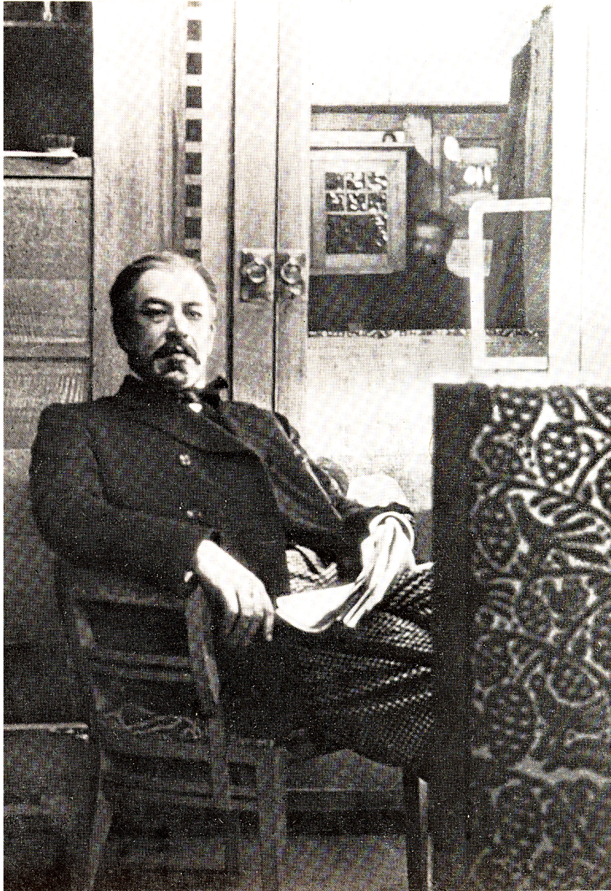
Ill. 155. Stanislavski dans sa loge, grisé pour le rôle de Gaev dans La Cerisaie de Tchekhov, photographie, sans date.