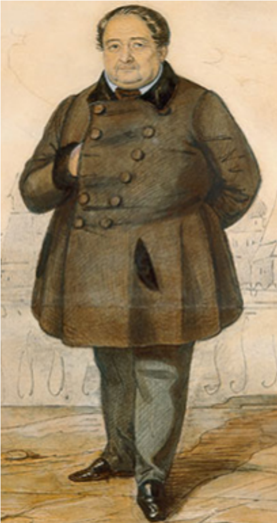
Ill. 146. Kozlov, Mikhail Chtchepkine , dessin d'après nature, première moitié du XIX e siècle.