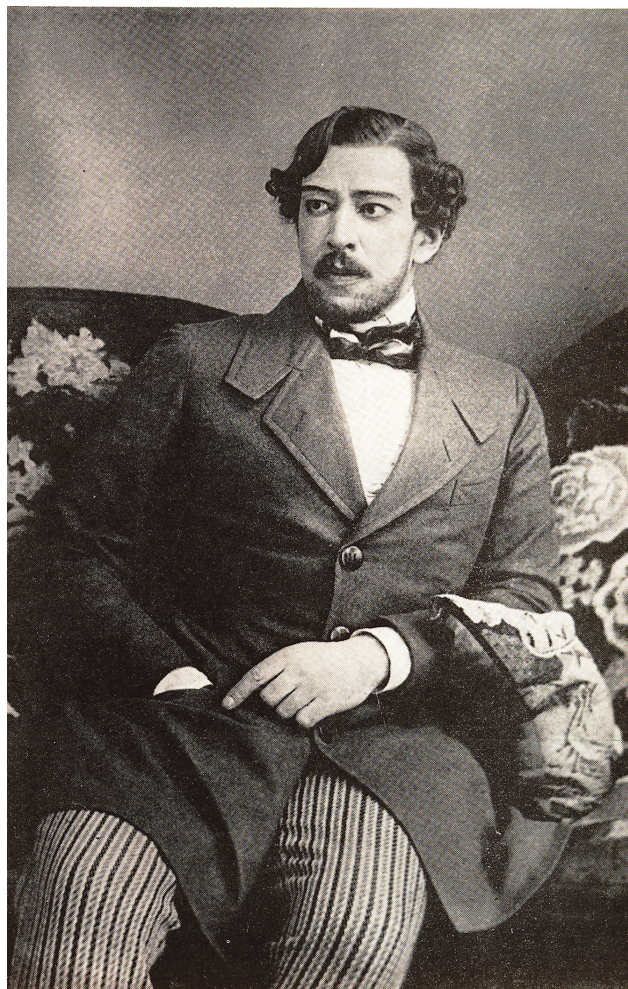
Ill. 160. Photographie de Stanislavski dans le rôle de Rakitine, Théâtre d'Art, 1909.