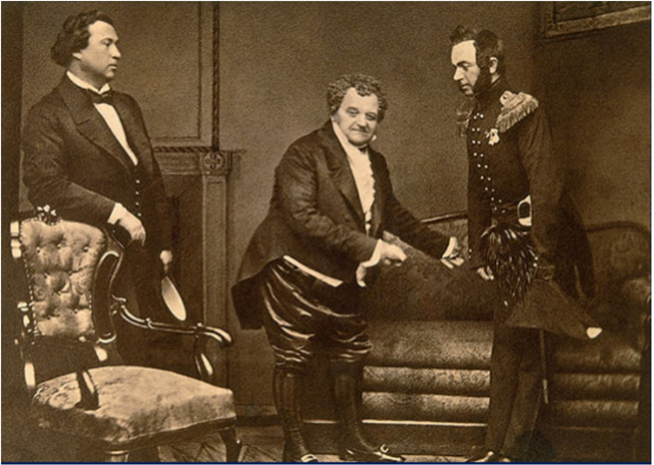
III. 147. Mikhaïl Chtchepkine au centre, dans le rôle de Famoussov, Le Malheur d'avoir de l'esprit d'Alexandre Griboïedov, Théâtre Maly, 1831 (photographie de la première moscovite).