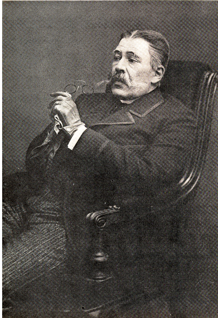
Ill. 157. Stanislavski dans le rôle du prince Abrezkov, Tolstoï, Un Cadavre vivant , Théâtre d'Art, mise en scène Stanislavski et Nemirovitch-Dantchenko, 1911.