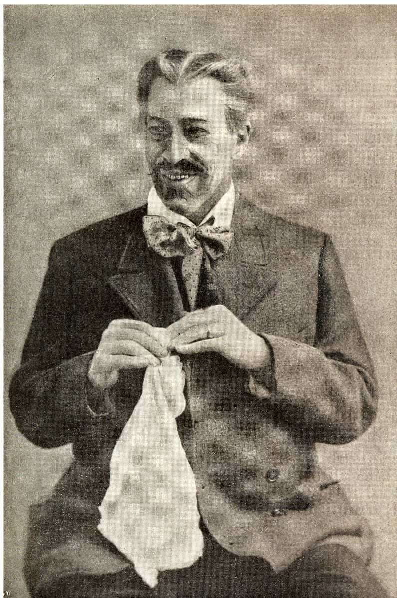
Ill. 154. Stanislavski dans le rôle de Gaev. Tchekhov, La Cerisaie , Théâtre d'Art, mise en scène Stanislavski et Nemirovitch-Dantchenko, 1904, photographie de 1908.