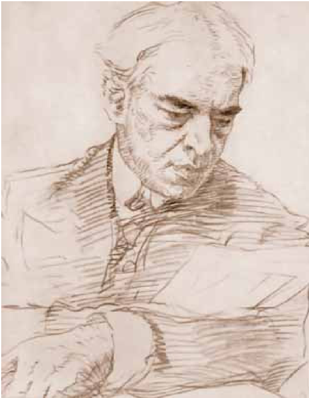
Ill. 166. Valentin Serov, Portrait de Stanislavski , 1908, 31 x 24 cm, mine de plomb sur papier, Moscou, Galerie Tretiakov.