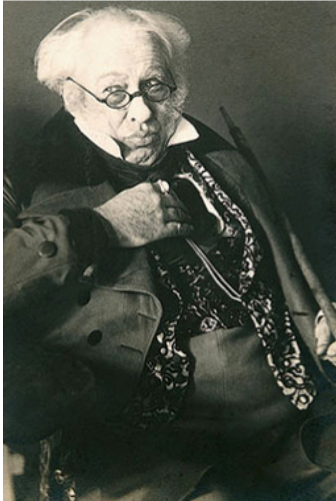
Ill. 156. Stanislavski dans le rôle de Fomussov, Le Malheur d'avoir de l'esprit de Griboïedov, mise en scène Stanislavski et Nemirovitch-Dantchenko, Théâtre d'Art de Moscou, 1906.