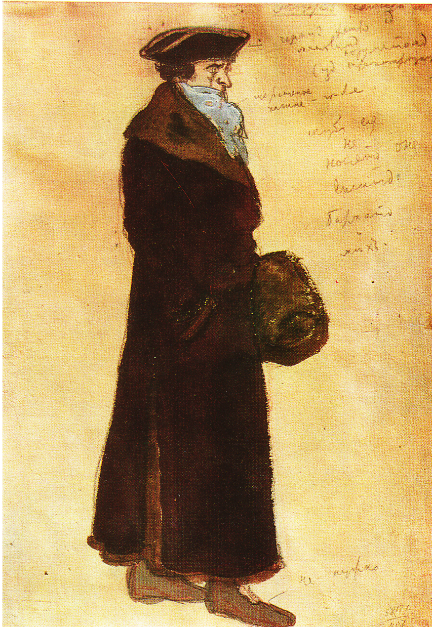
Ill. 165. Alexandre Benois, esquisse pour le rôle de Salieri joué par Stanislavski dans Mozart et Salieri de Pouchkine, mise en scène Alexandre Benois et Stanislavski, Théâtre d'Art, 1915.