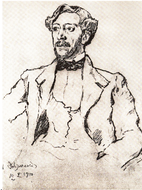
Ill. 159. Mstislav Doboujinski, dessin de Stanislavski dans le rôle de Rakitine dans Un Mois à la campagne de Tourgueniev en 1910, spectacle mis en scène par Stanislavski, Théâtre d'Art, 1910.