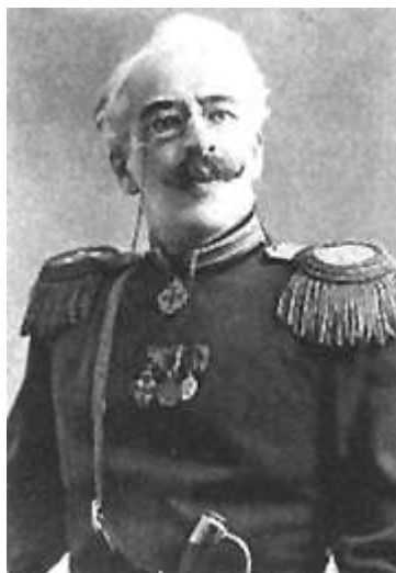
III. 153. Stanislavski dans le rôle de Verchinine, Les Trois sœurs de Tchekhov, mise en scène Stanislavski et Nemirovitch-Dantchenko, Théâtre d'Art, 1901.