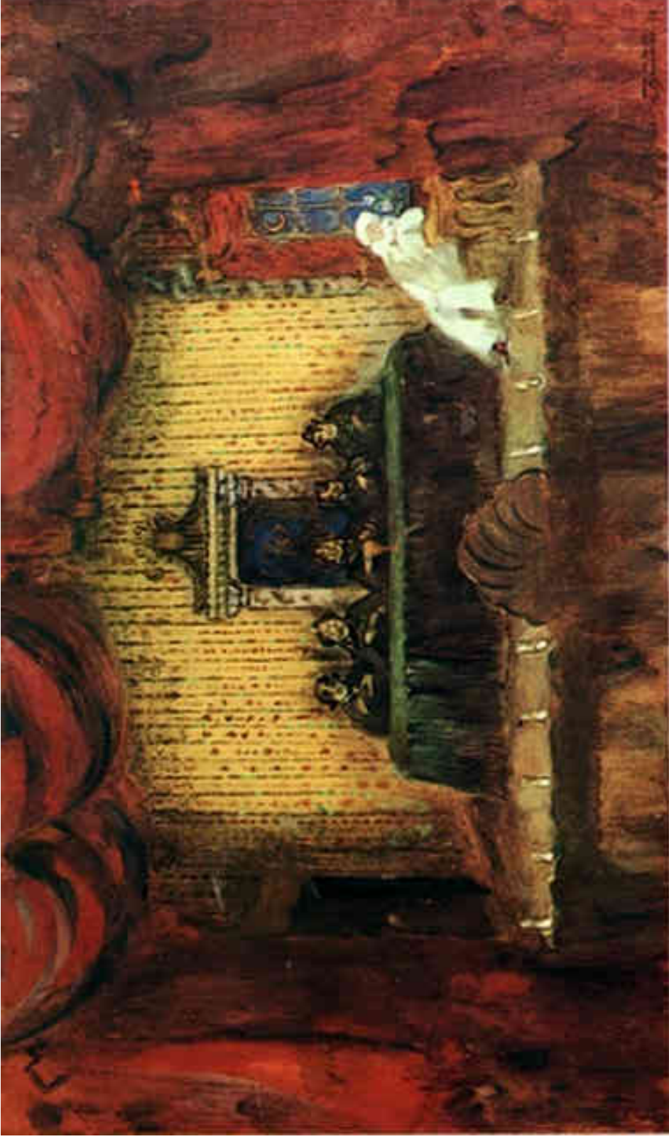
III. 103. Nicolas Sapounov, L'Assemblée mystique , d'après le décor pour La Baraque de Foire de Blok , mise en scène de V. Meyerhold au Théâtre de Véra Komissarjevskaïa en 1906, 1909, tempera, charbon et bronze, rehaussé d'or et d'argent, 42 x 84 cm, Moscou, Galerie Tretiakov.