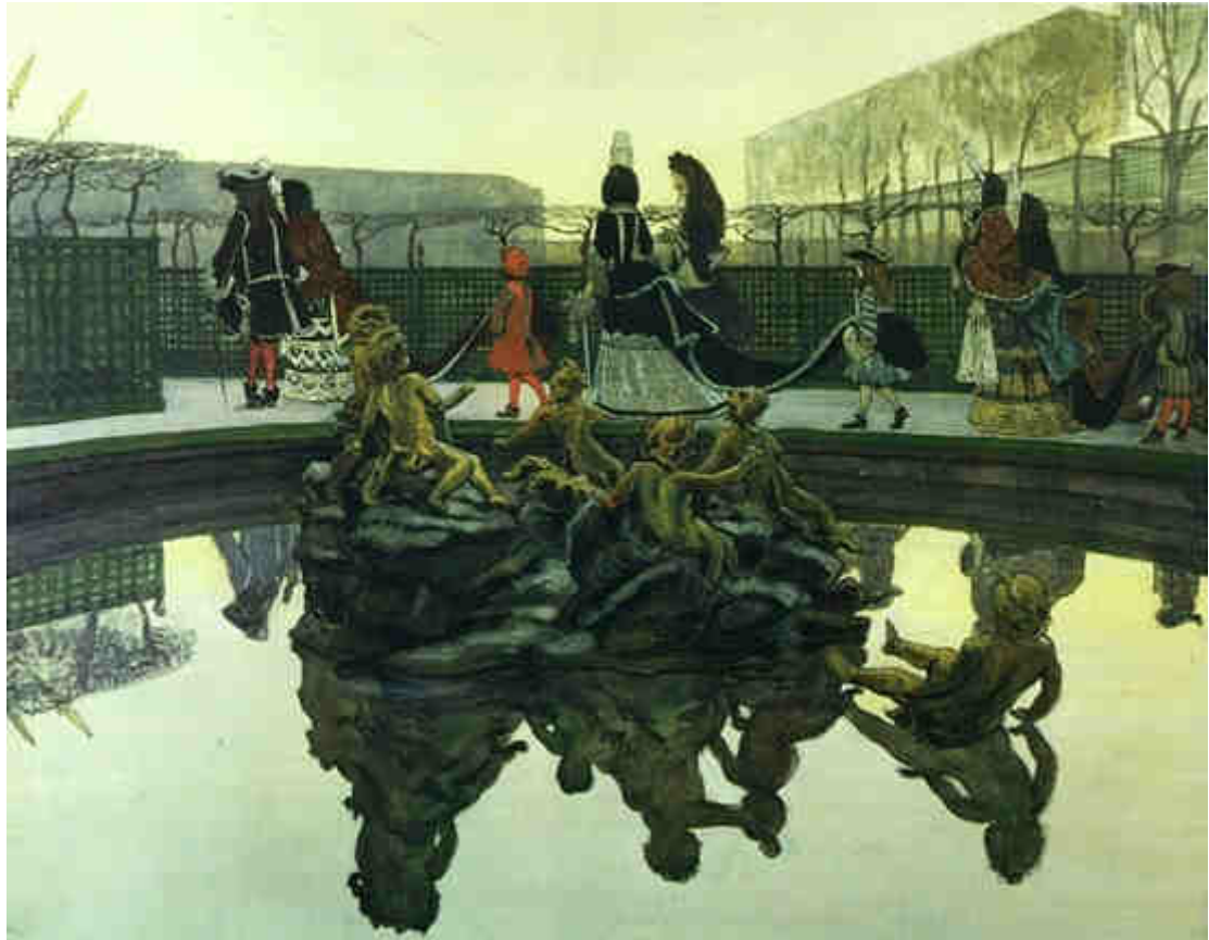
Ill. 102. Alexandre Benois, La Promenade du Roi , 1906, gouache, plume, pinceau, encre sur carton, 48 x 62 cm, Moscou, Galerie Tretiakov.