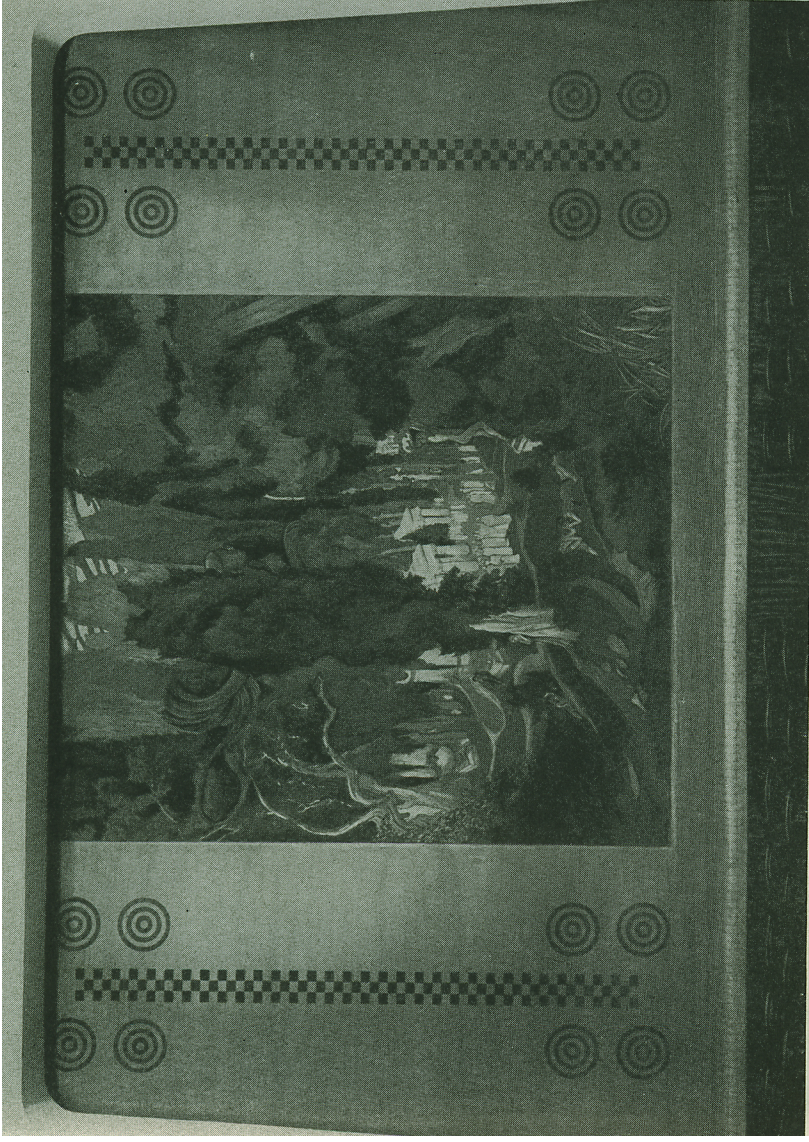
III. 104. Photographie du rideau de scène du théâtre de Véra Komissarjevskaja à Saint-Pétersbourg peint par Leon Bakst.