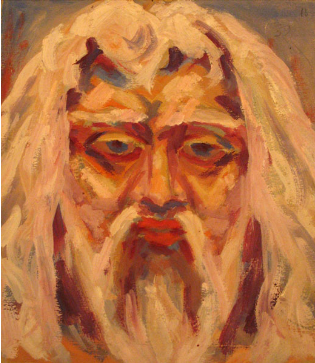
III. 95. Sergueï Soudeïkine, esquisse de grimage pour La Mort de Tintagiles , mise en scène de Vsevolod Meyerhold au Théâtre-Studio, Moscou, 1905, papier, crayon, aquarelle, Moscou, RGALI.