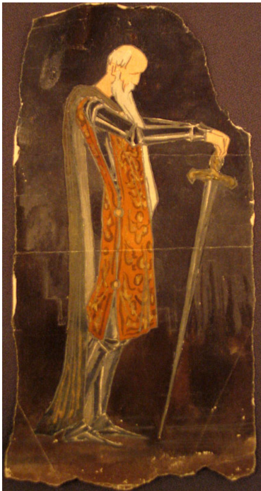
Ill. 96. Sergueï Soudeïkine, esquisse de costume pour La Mort de Tintagiles , mise en scène de Vsevolod Meyerhold au Théâtre-Studio, Moscou, 1905, papier, crayon, aquarelle, Moscou, RGALI.