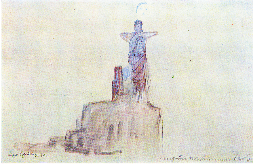
III. 97. Sergueï Soudeïkine, esquisse de costume pour La Mort de Tintagiles , mise en scène de Vsevolod Meyerhold, Théâtre-Studio, Moscou, 1905, papier, crayon, aquarelle.