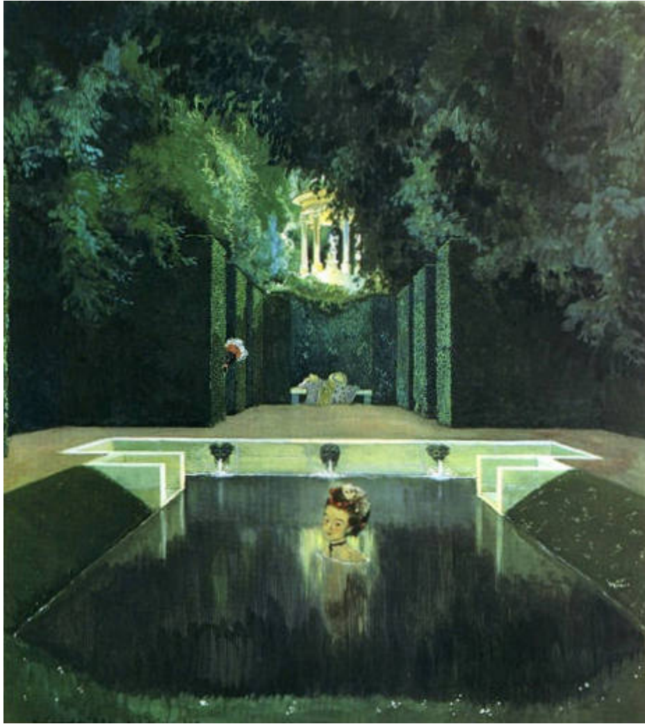
Ill. 101. Alexandre Benois, Le Bain de la marquise , 1906, gouache, plume, encre sur carton, 51 x 47,5 cm, Moscou, Galerie Tretiakov.