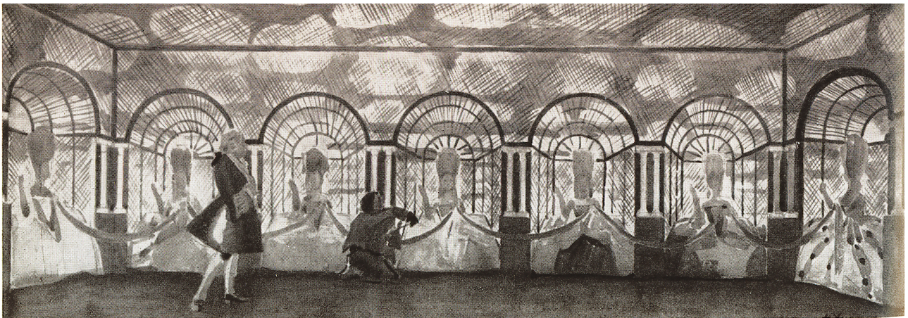
Ill. 100. Nicolaï Oulianov, esquisse de décors pour Schluck et Jau d'Hauptmann, Théâtre-Studio du Théâtre d'Art (mise en scène non réalisée), Moscou, Musée central théâtral Bakhrouchine.