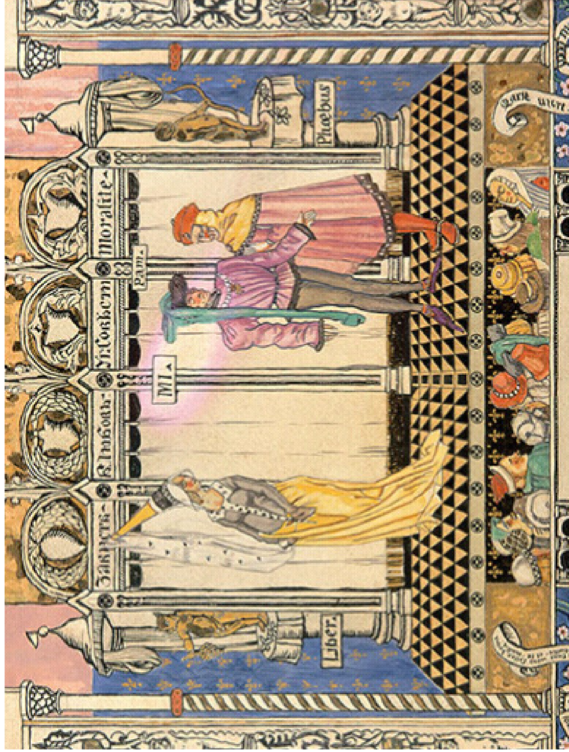
III. 90. V. A. Chtchouko, Esquisse de décor pour une moralité du XVI e siècle , Théâtre ancien, 1907, Moscou, Musée central théâtral Bakhrouchine.