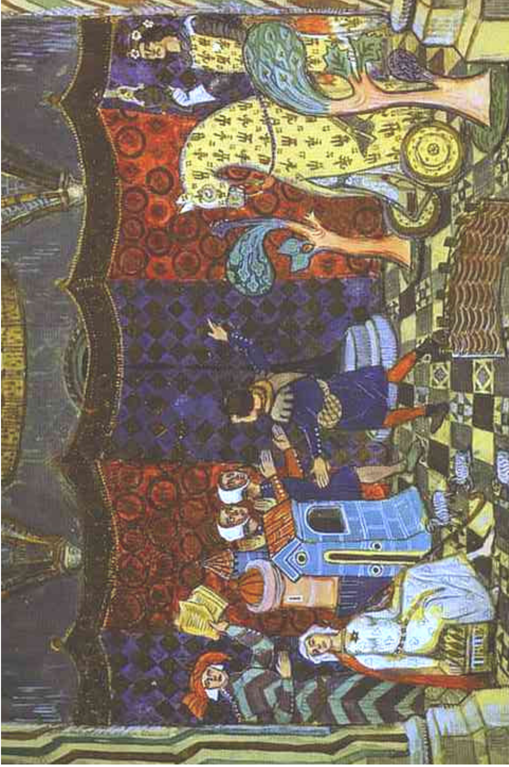
Ill. 91. Mstislav Doboujinski, esquisse pour la pastourelle d'Adam de la Halle, Le Jeu de Robin et Marion , Théâtre ancien, 1907, Moscou, Musée central théâtral Bakhrouchine.