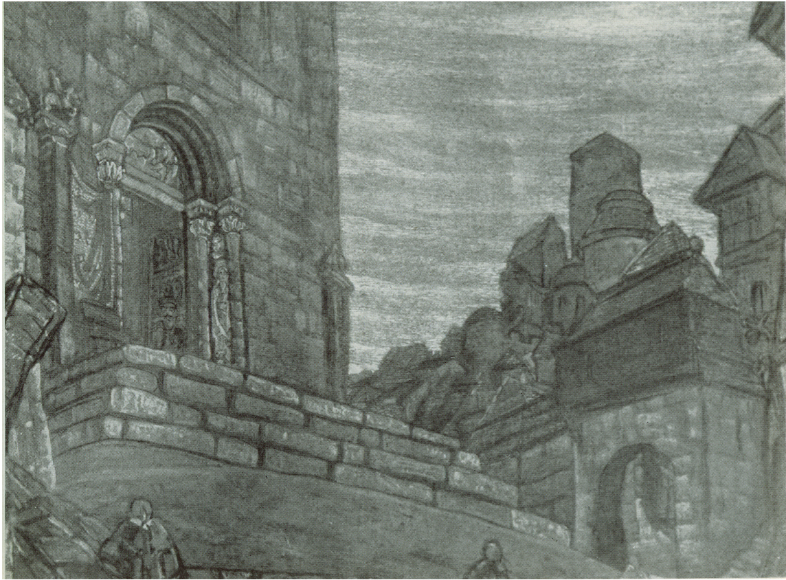
Ill. 89. Nicolas Roerich, esquisse de décor pour le drame liturgique de Nikolai Evreïnov, Les Trois rois mages , Théâtre ancien, Saint-Petersbourg, 1907, Moscou, Musée central théâtral Bakhrouchine.