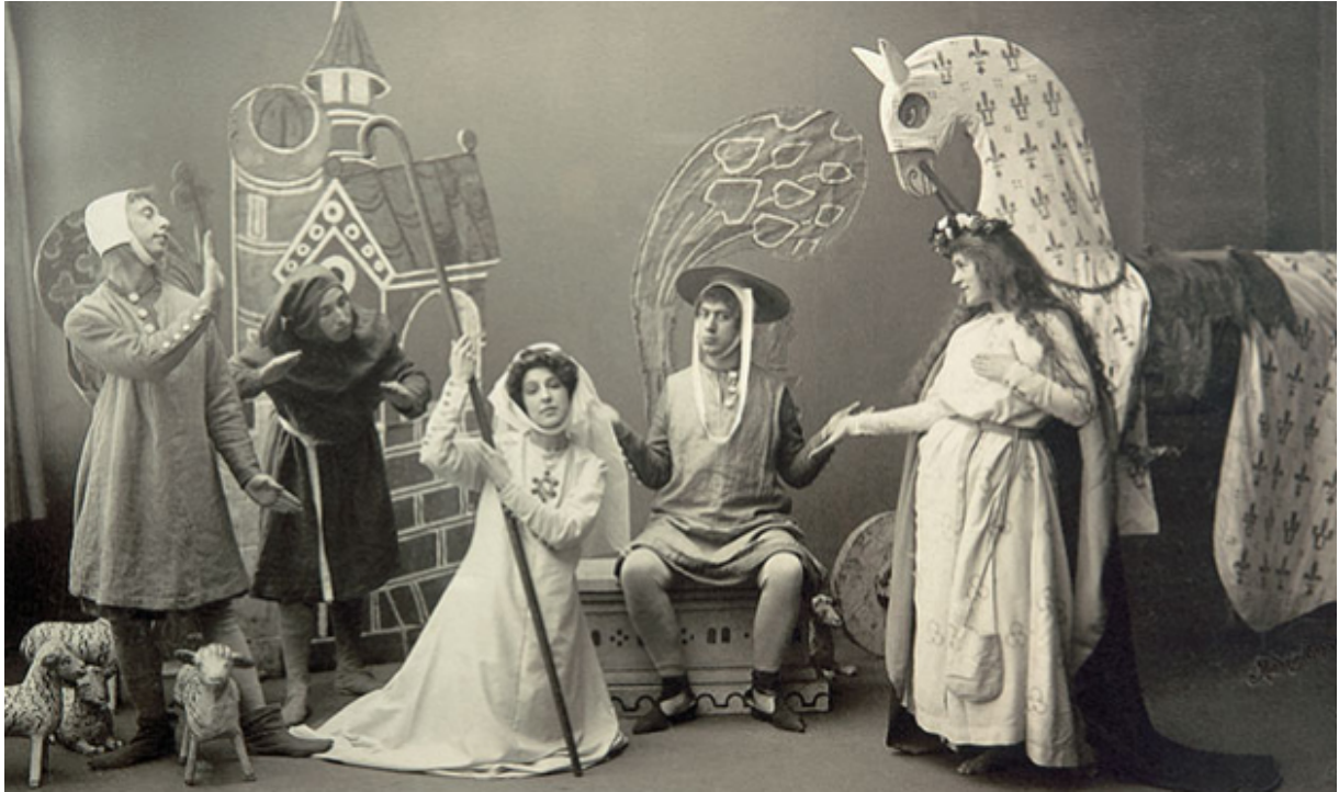
III. 92. Scène du spectacle Le Jeu de Robin et de Marion d'Adam de la Halle, costumes et accessoires M. Doboujinski, photographie, Théâtre ancien 1907.