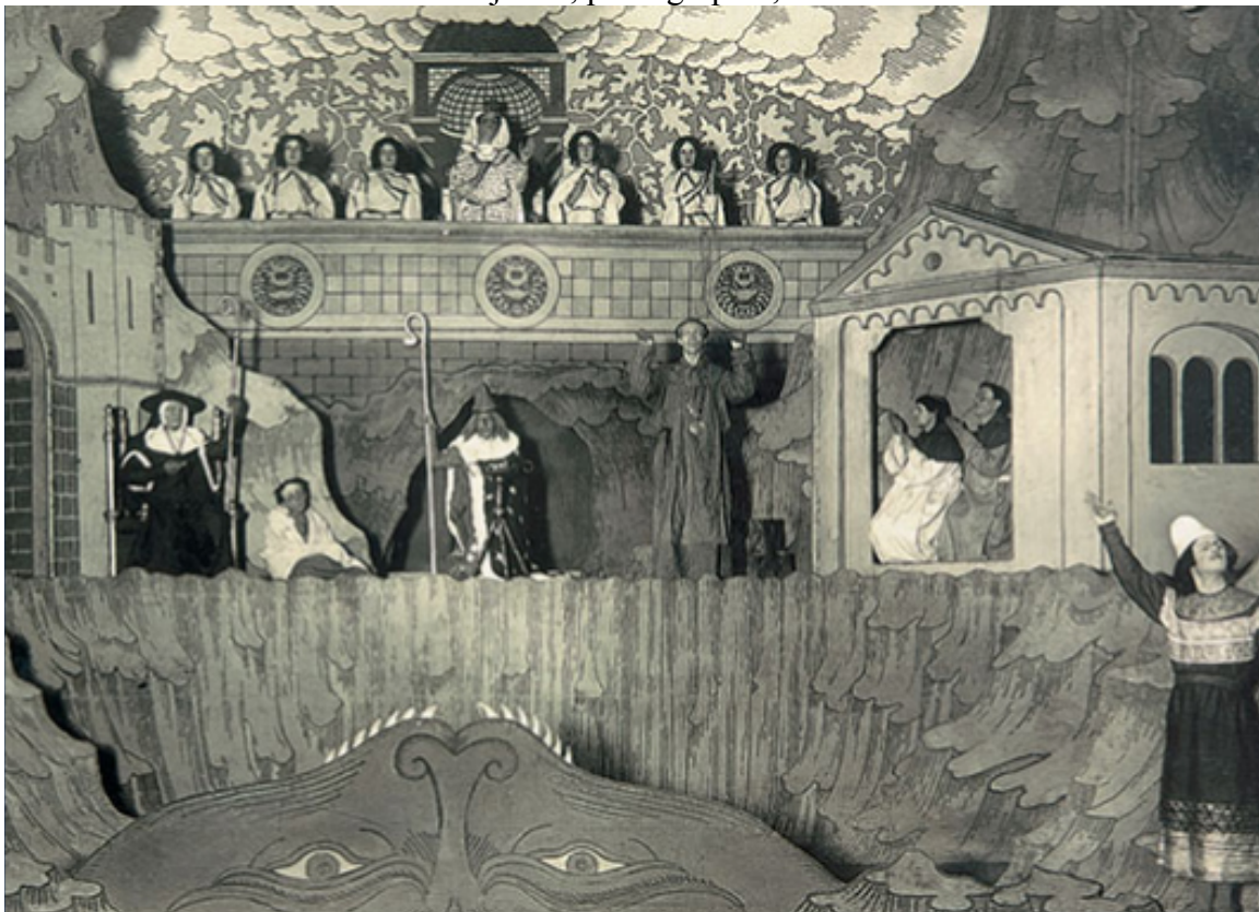
III. 93. Scène du spectacle Le Miracle de Théophile de Rutebeuf, décors et costumes réalisés sur des esquisse d'Ivan Bilibine, photographie, Théâtre ancien, 1907, Musée central théâtral Bakhrouchine.