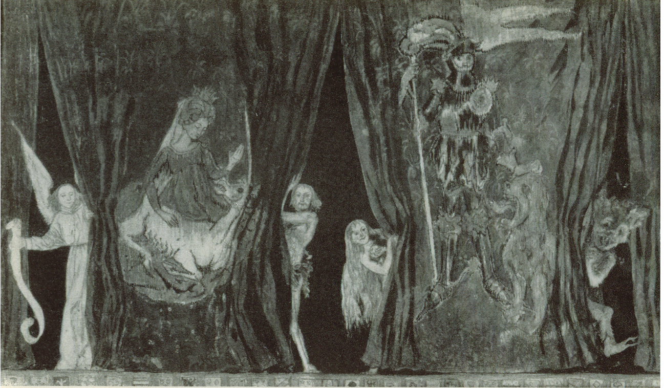
Ill. 88. Alexandre Benois, Esquisse de rideau pour le Théâtre ancien , 1907, Moscou, Collection Zilberstein.