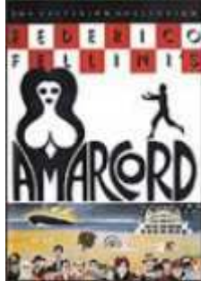
AMARCORD (película de Fellini 1973)